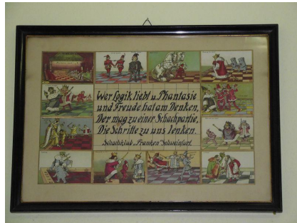
Motto des Schachklub Franken SW