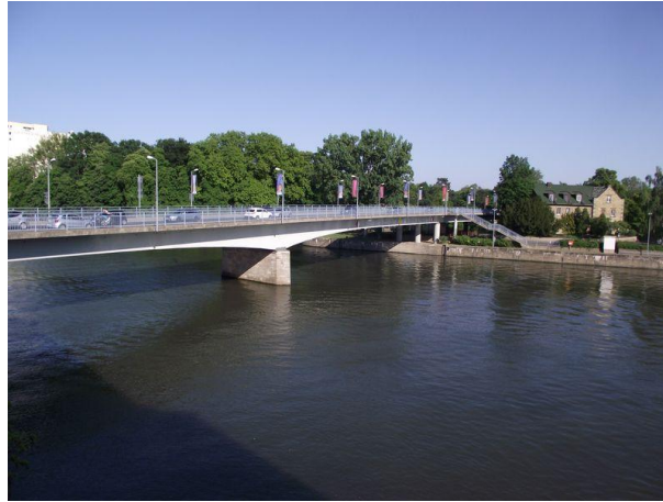
direkt an der Max-Brücke am Main gelegen