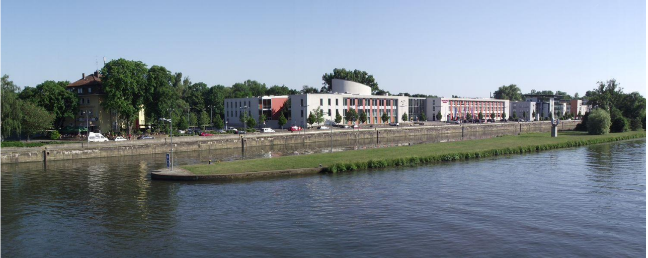
Blick aus dem Fenster zum Konferenzzentrum und Maininsel