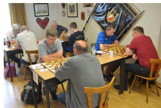
Spitzenbretter der Runde 6