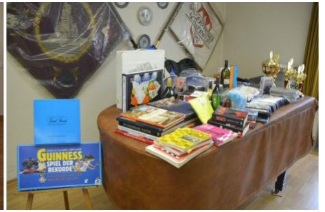
Preise und Pokale