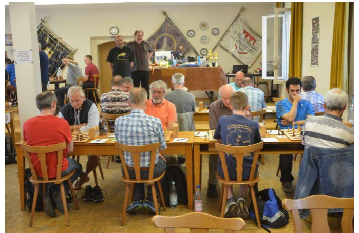
Die längsten Partien der Schlußrunde: